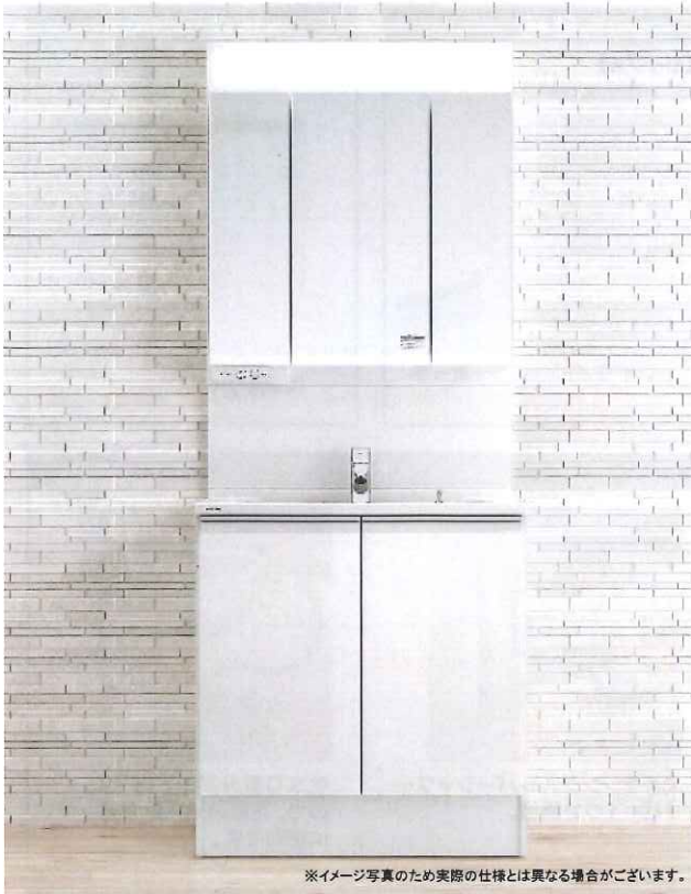
※イメージ写真のため実際の仕様とは異なる場合がございます。