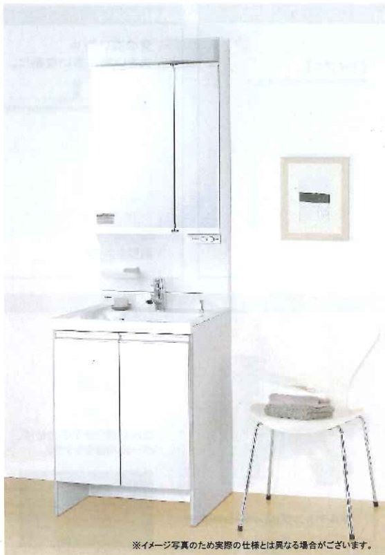
※イメージ写真のため実際の仕様とは異なる場合がございます。