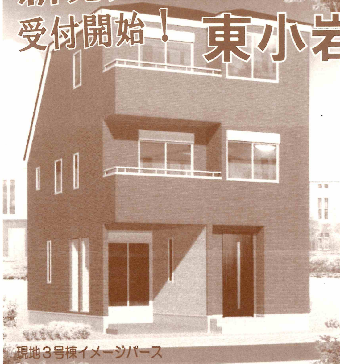
現地3号棟イメージパース